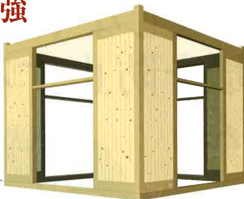
吸震工法「壁柱」 構造イラスト

京都大学防災研究所と 共同特許出願中。 信頼性の高い耐震工事として 安心できます。